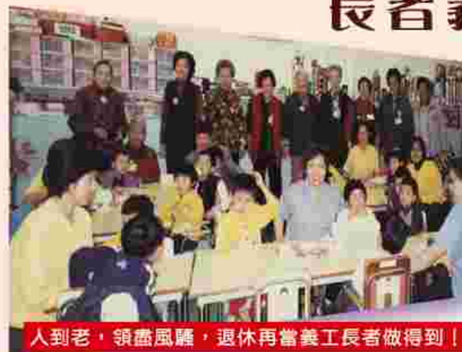
人到老，領盡風騷，退休再當義工長者做得到！