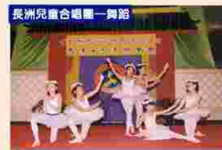
長洲兒童合唱團—舞蹈