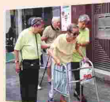
互相幫助 扶持弱老