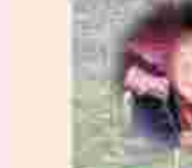
溫浩根護理院 羅八妹 97歲