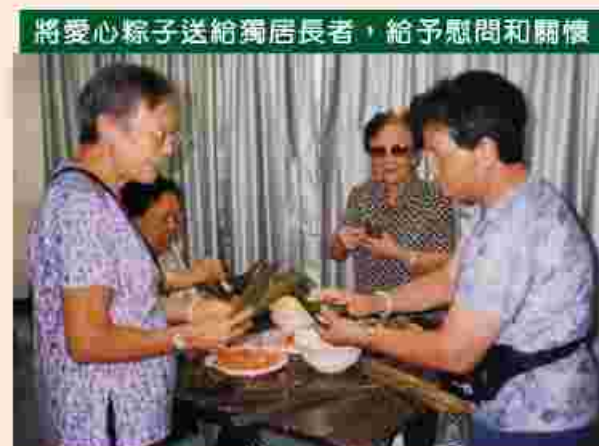
將愛心粽子送給獨居長者，給予慰問和關懷