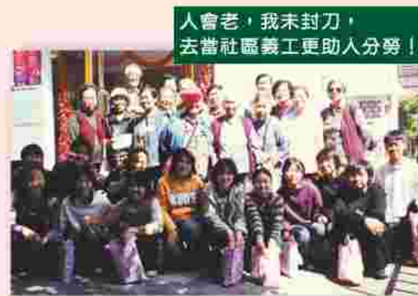
人會老，我未封刀，去當社區義工更助人分勞！