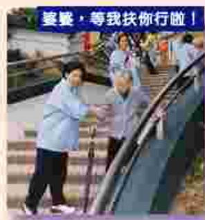
婆婆，等我扶你行啦！

儀式於當日下午三時三十分進行，出席主禮嘉賓包括：離島民政事務專員陳念德太平紳士、社會福利署中西區及離島區策劃及統籌小組主任鍾惠敏女士、長洲鄉事委員會主席翁志明區議員、敬老大會贊助人溫浩根永遠董事、珠海市國土資源局駱馳書記、珠海市擔杆鎮郭一兵鎮長及長洲各敬老社團出席參與及支持。