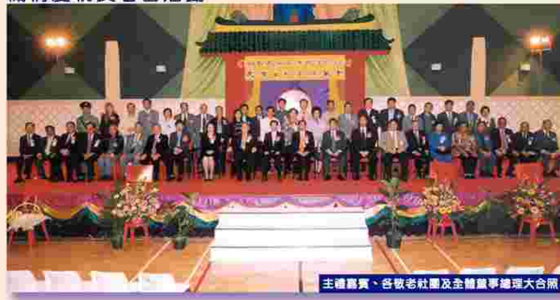
主禮嘉賓、各敬老社團及全體董事總理大合照

本機構亦響應「老人節」及「長者日」，每年於11月都會舉辦長者活動，至今已達24年。歷屆長者日圍繞不同主題(主題名稱請參閱本頁附表)喚起社區人士關懷長者生活及權益。上年一年一度長者敬老千叟宴於2002年11月2日舉辦一年一度長者日敬老千叟宴，該次活動參加長者達1,300多位，場面熱鬧非常。