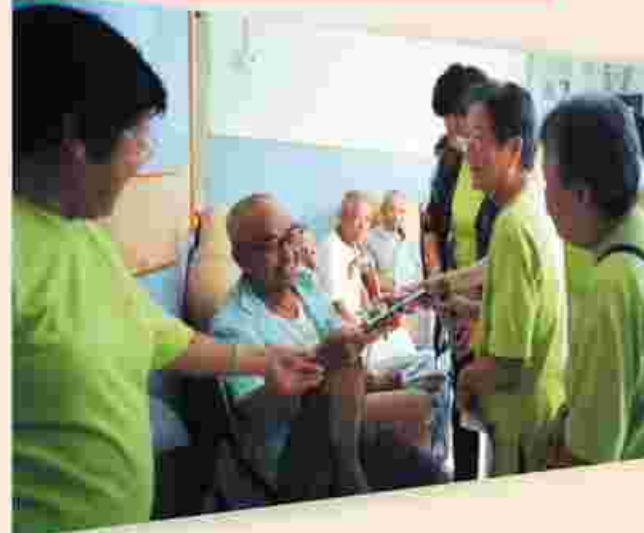
探訪院舍長者，我地一齊唱歌、玩遊戲，好開心！