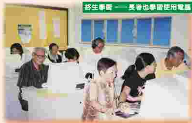
終生學習——長者也學習使用電腦

本會經已向社會福利署遞交申請書，準備在今年四月開始轉型為長者鄰舍中心，屆時中心將會延長服務時間（每星期開放六日，星期一至六，上午八時至下午六時），並且與本會所有單位—安老院、護理院、日間護理中心和地區上的服務機構、社團、學校等進行協作，逐步建立策略性聯繫，以擴展上述的九項功能，為長洲區內的長者提供一站式和多元化服務，以期能更有效和妥善地照顧長者不同的需要。希望大家可以多提意見，讓我們攜手合作，致力提升長者的生活質素。