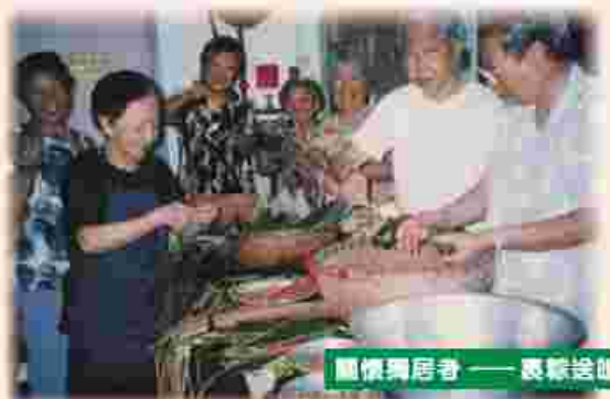
關懷獨居者——裹粽送禮