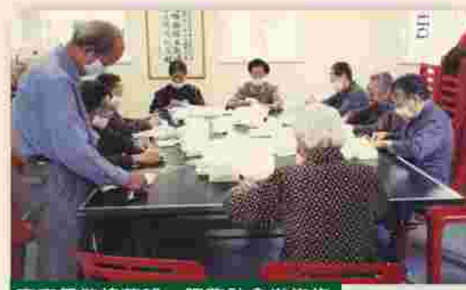
齊齊學做棉花球 服務社會樂悠悠