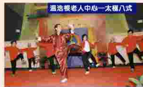
溫浩根老人中心—太極八式