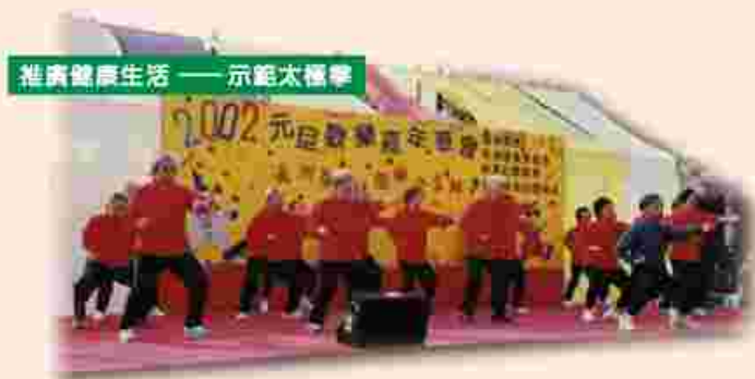
推廣健康生活——示範太極拳