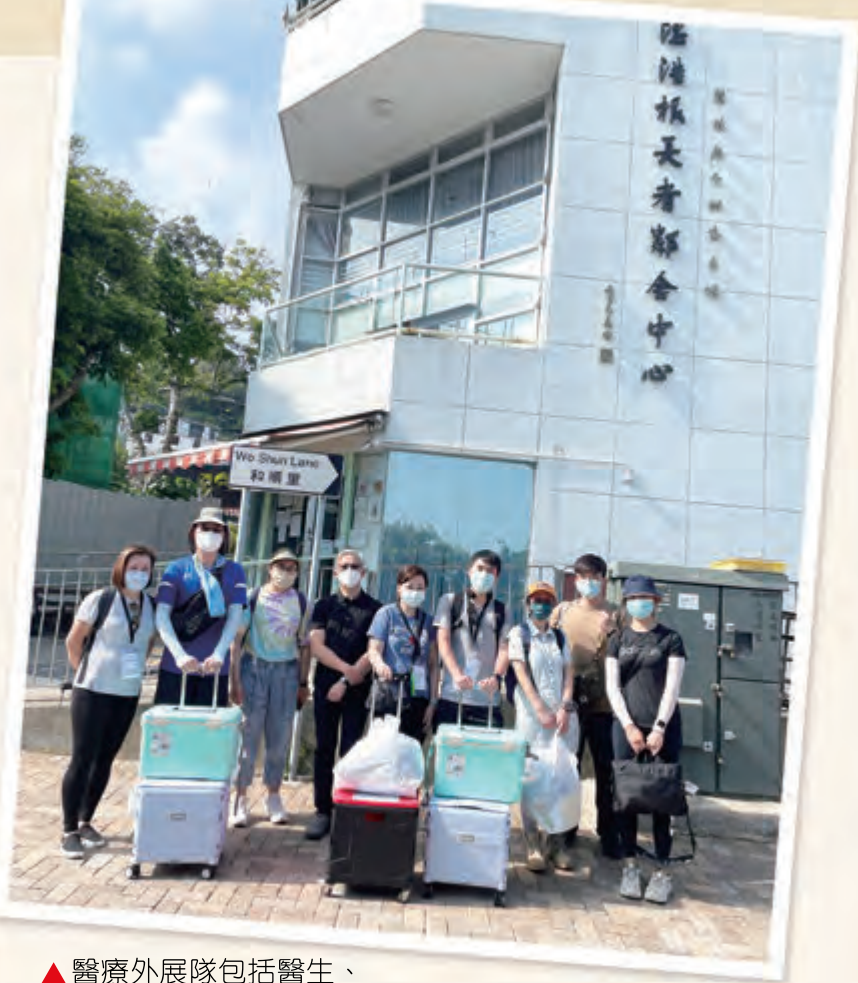
▲ 醫療外展隊包括醫生、護士、護士助理、中心職員。