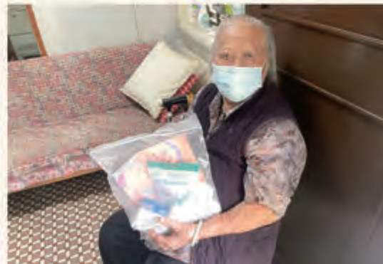
▲ 除了為長者接種疫苗，更送上抗疫福袋。鼓勵長者日常生活都注意抗疫，祝福各位長者身體健康。