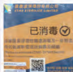
工作完成，由消毒公司發出認證。