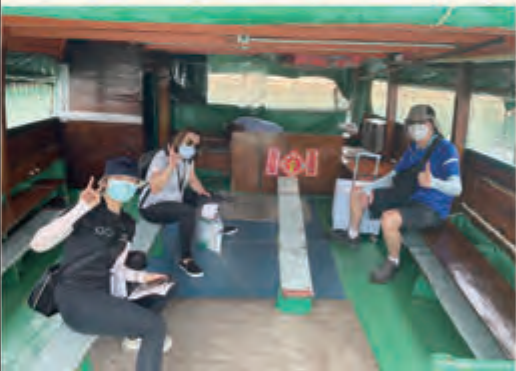
▲ 當日外展隊上山上海，只為到長者家為長者接種疫苗提高抵抗能力。

預防染疫後帶來重症和死亡的風險，接種新冠疫苗是有效的方法。我們亦了解有些長者因行動不便難以外出到社區接種疫苗。因此，鄰舍中心與香港社會服務聯會合作，透過「疫苗易」家居接種計劃，為有需要的中心會員及社區人士提供上門打針的服務，讓更多長者得到健康上的保障。在是次計劃中，共協助了26位長者接種疫苗。