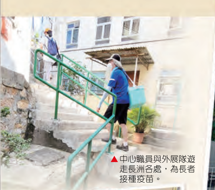
▲ 中心職員與外展隊遊走長洲各處，為長者接種疫苗。