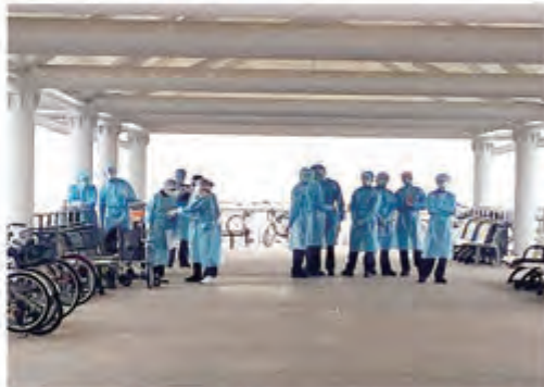
總幹事與副總幹事整裝待發去接院友