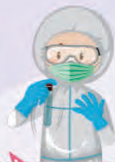
消毒公司職員在院舍每個角落噴灑塗層。