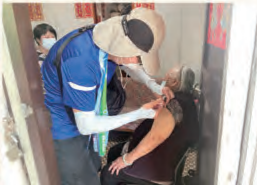
▲ 在醫生為長者判斷合適接種新冠疫苗後，由醫生親自為長者打針。