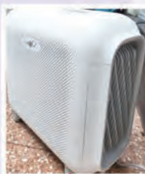
掛牆式空氣淨化機及流動式空氣淨化機