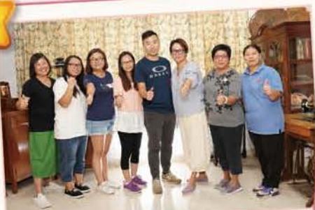
鍾錫-留住這時光活動 (2018-9-8 懷舊園)

1998年機構又創新里程，開辦離島首間護理安老院，在2001年長者日間中心也面世。眼見機構由一個單位幾名員工增至四個服務單位，全機構約80多位員工，至今天更有150多位員工，成為長洲區內最多員工的機構，這個發展實有賴總理會及管理層各前賢對服務的前瞻及積極推動。