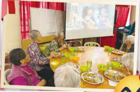
親友親自彈奏及歌唱，母親愉快地欣賞!