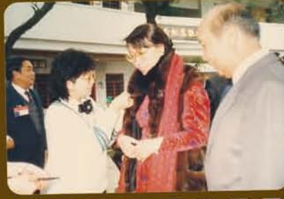
接待前社署署長黃錢其濂到訪 (1988年安老院)