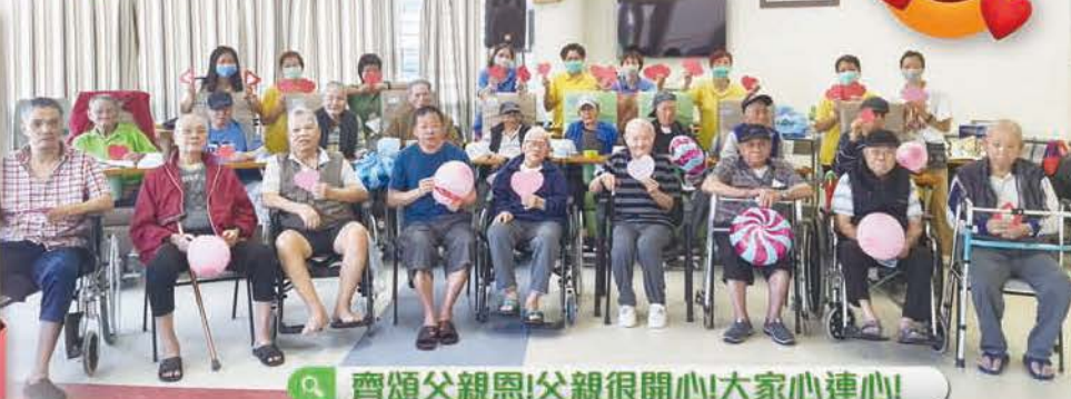
齊頌父親恩!父親很開心!大家心連心!