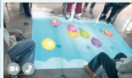
合作踩氣球奪分數