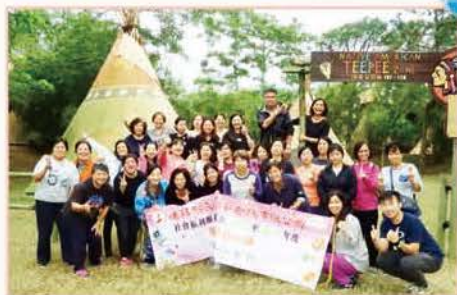
歷奇課程 (2018-11-28 長洲西園)