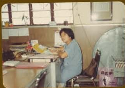
入職初期的辦公室 (1982年安老院)