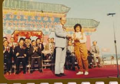
創院廿周年暨老人節活動 (1988-11-19 星有利球場)