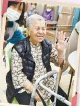
「呢個係我個女、孫、曾孫……！」「好開心…好多謝佢咗呀！」