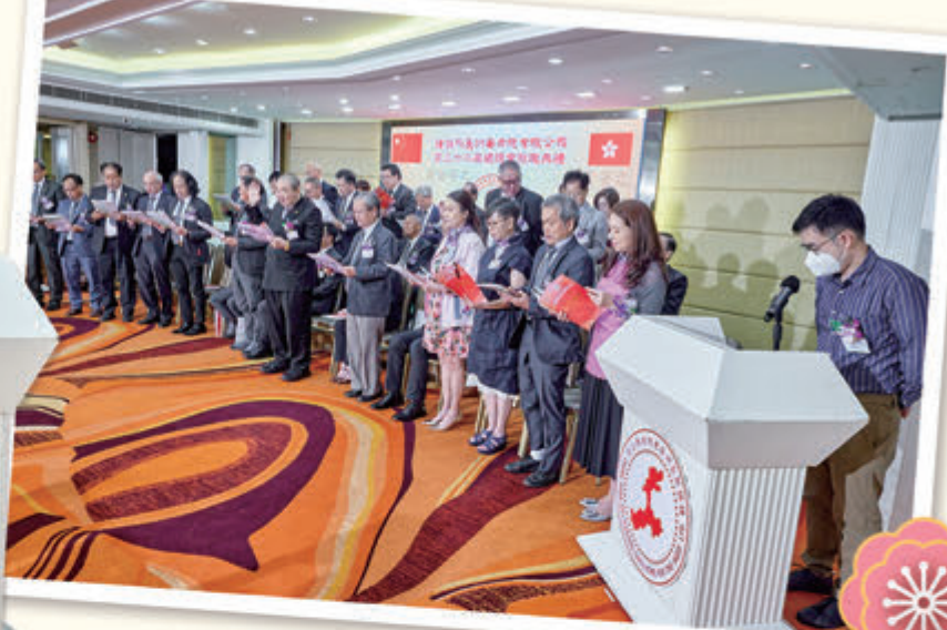
▲ 離島民政事務助理專員李豪先生帶領總理會宣誓就任。