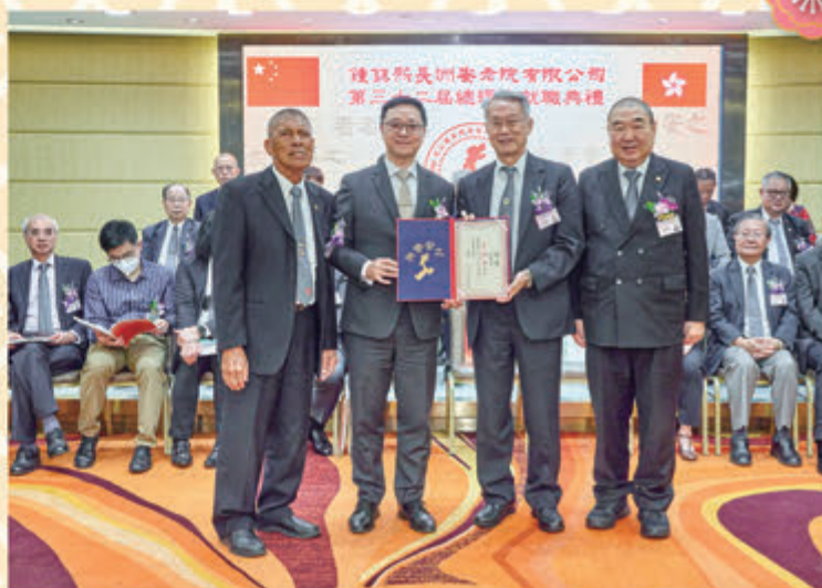
▲ 懲教署署長黃國興先生CSDSM頒發顧問聘任書