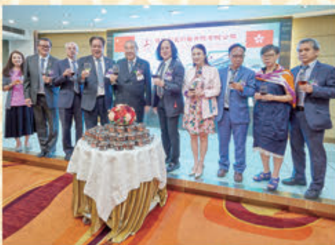
▲ 總理會正副主席們留影