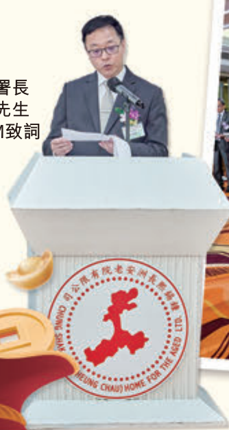
▲ 懲教署署長黃國興先生CSDSM致詞