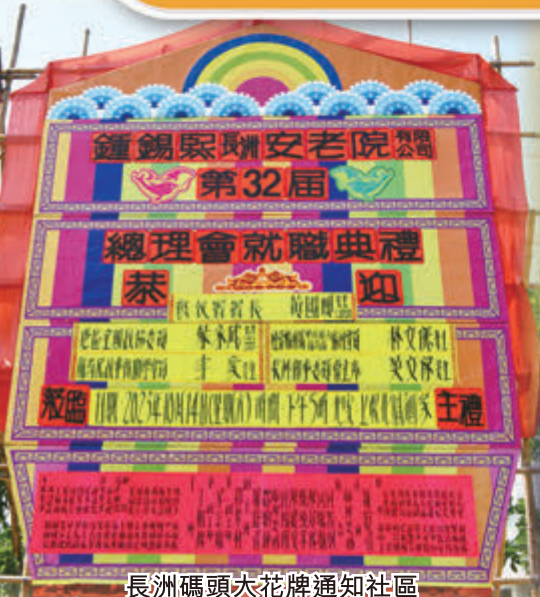
長洲碼頭大花牌通知社區