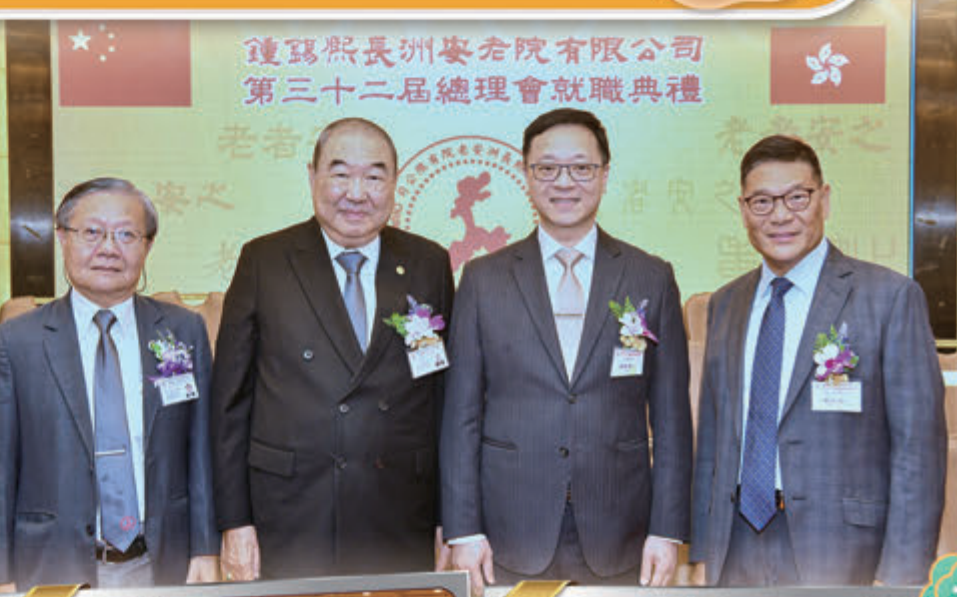
▲ 主禮嘉賓及一眾到場嘉賓進場時簽名留情影