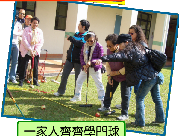
一家人齊齊學門球