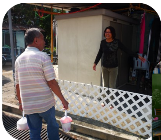
受訪者歡迎長者義工到訪

家福會於當天早上精心泡製溫暖的「愛心湯水」，並於下午將「愛心湯水」運送至本中心。當天共有十八名中心義工參與本活動。他們按安排將湯水送給各受惠長者。當受惠長者知悉義工上門探訪時，感到愉快及溫暖。這次活動不單止令受惠長者得到溫暖的「愛心湯水」，並因義工的探訪倍感溫暖。