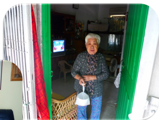
受惠長者收到「愛心湯水」 笑逐顏開