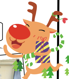
大家都好俾心機砌拼圖

雖然聖誕是西方國家的節日，但中心一班老友記都好喜歡這個節日，因為能夠在聯歡會與其他老友記一同玩遊戲、抽獎、吃茶點，開開心心過聖誕，所以中心在12月23日舉辦了聖誕聯歡會，與一班老友記一同賀聖誕。