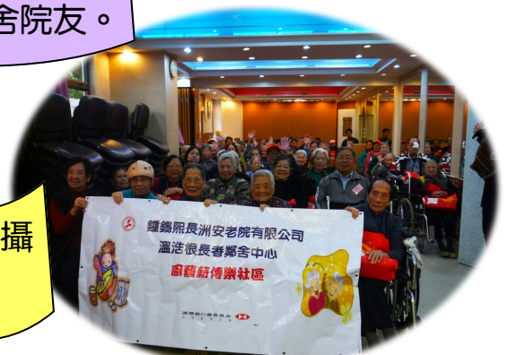
院友與長者義工拍攝大合照留念。