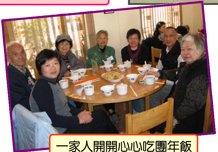
一家人開開心心吃團年飯