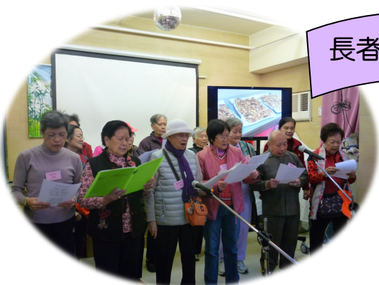
長者義工合唱歌曲獻給院舍院友。

第三天（十二月十七日）中心長者義工到島外的竹林明堂護理安老院探訪，並將小食及禮物贈送給該院院友。除此以外，中心義工更獻唱多首聖誕歌曲，在場洋溢著歡喜快樂的氣氛！