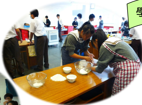
學生正在預備製作材料。