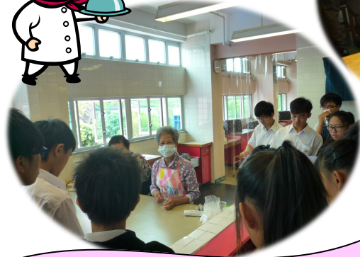
長者導師教授學生製作脆麻花。