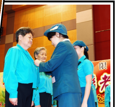
總監為樂齡女童軍扣上宣誓章