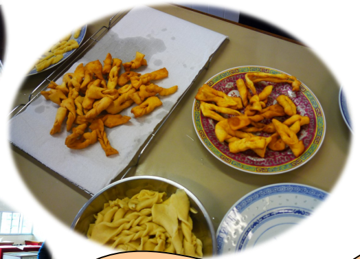
這就是長者導師及學生們的製成品。