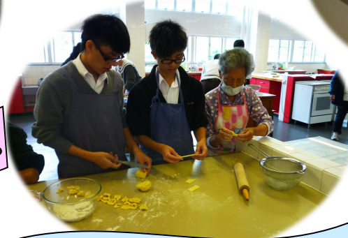
長者導師與學生合力製作小食。

第三天（十二月十七日）中心長者義工到島外的竹林明堂護理安老院探訪，並將小食及禮物贈送給該院院友。除此以外，中心義工更獻唱多首聖誕歌曲，在場洋溢著歡喜快樂的氣氛！