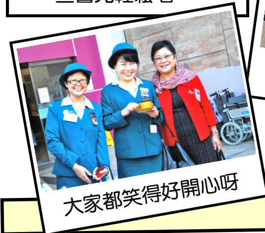
大家都笑得好開心呀