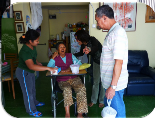
義工到訪 倍感溫暖