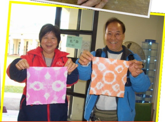
色彩、創意十足的扎染製成品