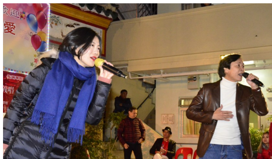
「網紅小龍女」與「旺角羅文」合唱經典流行曲-問誰領風騷助慶。