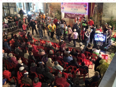
表演嘉賓邀請會員出來到台前一起跳舞！