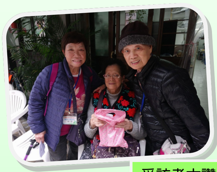
受訪者大讚小禮物有心思

不經不覺，老有所為活動計劃「環保耆兵」已經來到尾聲了。多得一眾義工的支持和愛心付出，中心得以預備了200份自製的環保產品贈送予區內不同人士，向他們分享愛心和宣揚環保訊息。中心希望能藉此活動倡議義工和社區人士對環保的關注，藉此機會，再一次感謝各義工和導師的付出！