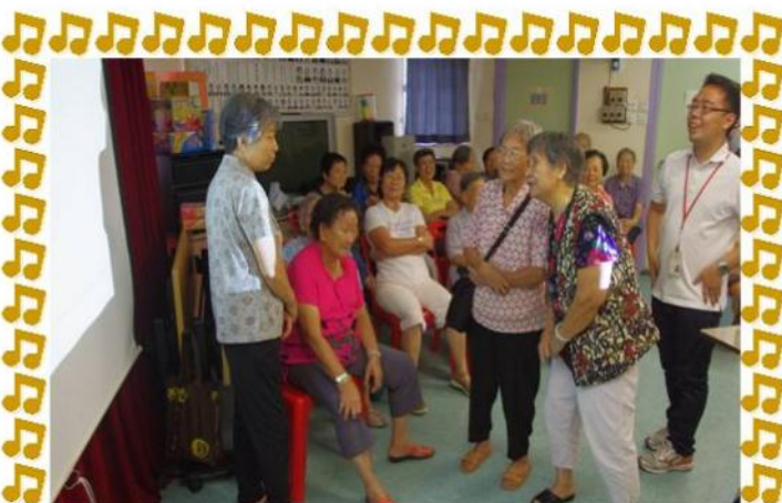
參加者施展渾身解數，表達投幕內的詞語。

遊戲過後，工作人員向義工預告中心下半年的義工活動，並邀請義工積極參與。其後參加者享用由義工預備的茶點。預備茶點的義工除了為一眾義工提供美食外，更能夠發揮自己的才能，這就是可貴的義工精神！