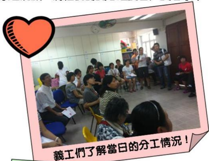
義工們了解當日的分工情況！

今年度與長洲浸信會合作，舉辦《愛心清潔大行動》，活動透過義工訓練，教導義工與長者溝通及探訪技巧，並探訪區內的獨居長者，部份年青力壯的義工們，更協助長者進行簡單的家居清潔，將他們的愛心送到各戶長者家中，讓長洲建立成敬老愛老的社區。