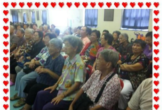
當日共有60名義工參與，場面熱鬧。