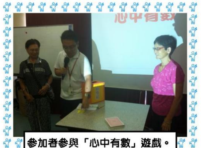
參加者參與「心中有数」遊戲。

第一個環節是與參加者玩遊戲。其中一個遊戲「好容義」是讓參加者透過身體動作，幫助組員猜出螢光幕內關於長者義工組的詞彙。例如義工服務名稱及義工專有物件等等。各組參加者皆落力參與，並且互相合作，務求在指定的時間猜出最多的詞語。其他義工也在旁鼓勵。活動氣氛推至高峰。