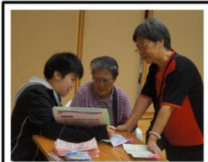
社區支援服務諮詢服務

在未來的日子，「護老愛老·我做到」計劃將會繼續透過不同類型的活動，如節日探訪院舍長者、護老家庭旅行等活動，推動關愛長者的文化，希望那時大家可以繼續積極參與，一同在社區推動關愛長者的文化，就如活動名稱一樣，「護老愛老」由我做起！