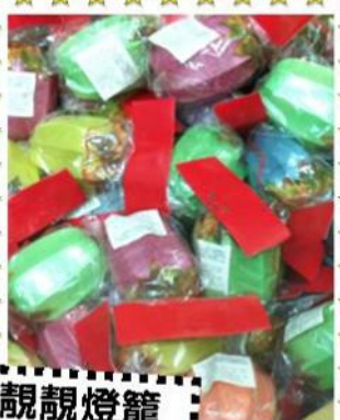
靚靚燈籠 人人有份