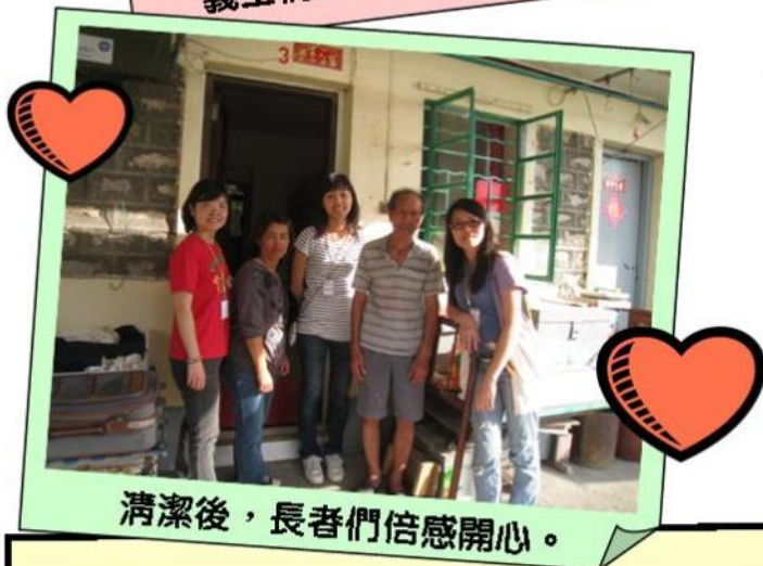
清潔後，長者們倍感開心。