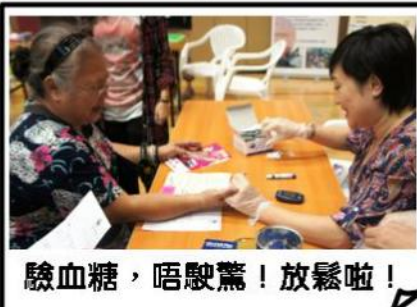
驗血糖，唔駛驚！放鬆啦！