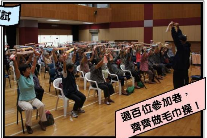
過百位參加者，齊齊做毛巾操！