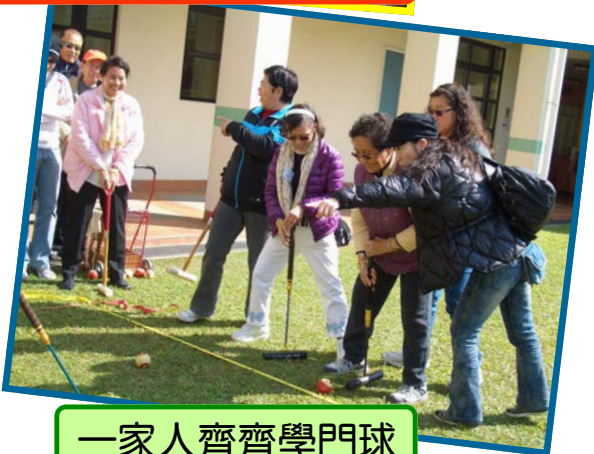
一家人齊齊學門球