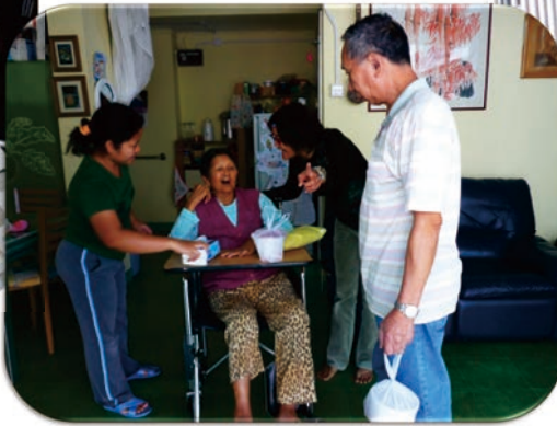
義工到訪 倍感溫暖