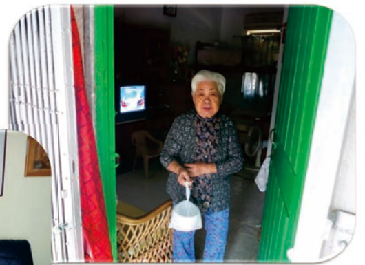
受惠長者收到「愛心湯水」 笑逐顏開