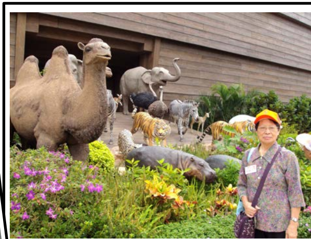
方舟入面原來住到好多動物架