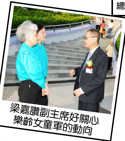
梁嘉讚副主席好關心 樂齡女童軍的動向