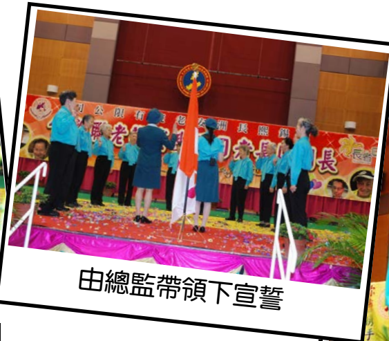
由總監帶領下宣誓