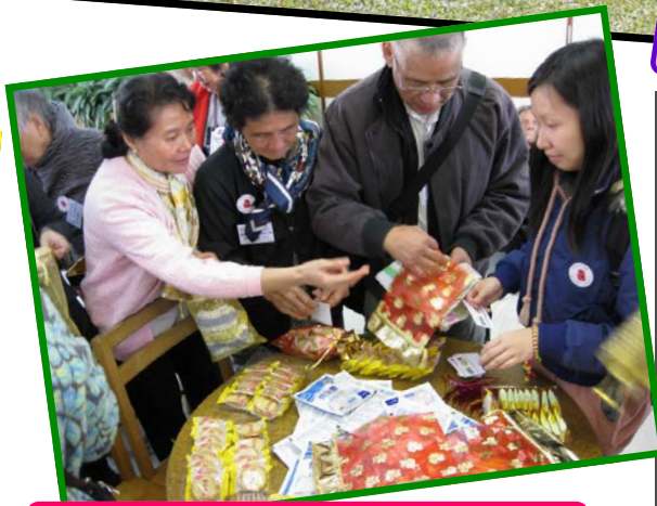
包裝愛的禮物福袋送給至親