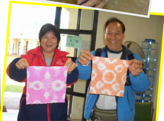
色彩、創意十足的扎染製成品