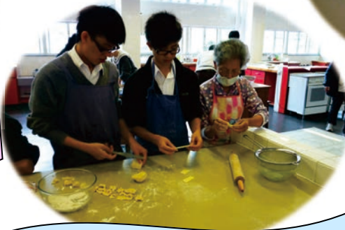
長者導師與學生合力製作小食。

第三天（十二月十七日）中心長者義工到島外的竹林明堂護理安老院探訪，並將小食及禮物贈送給該院院友。除此以外，中心義工更獻唱多首聖誕歌曲，在場洋溢著歡喜快樂的氣氛！