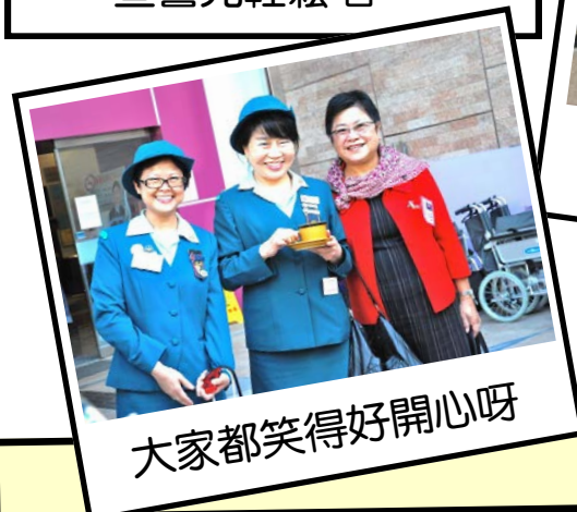
大家都笑得好開心呀