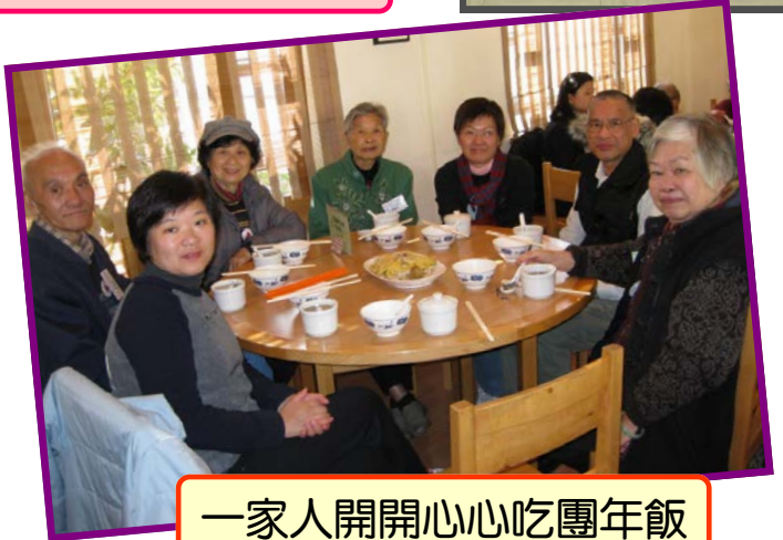
一家人開開心心吃團年飯