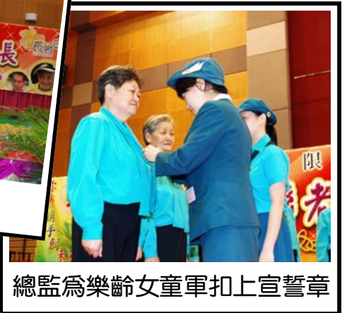
總監為樂齡女童軍扣上宣誓章