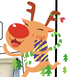
大家都好俾心機砌拼圖

雖然聖誕是西方國家的節日，但中心一班老友記都好喜歡這個節日，因為能夠在聯歡會與其他老友記一同玩遊戲、抽獎、吃茶點，開開心心過聖誕，所以中心在 12 月 23 日舉辦了聖誕聯歡會，與一班老友記一同賀聖誕。