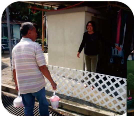
受訪者歡迎長者義工到訪

家福會於當天早上精心泡製溫暖的「愛心湯水」，並於下午將「愛心湯水」運送至本中心。當天共有十八名中心義工參與本活動。他們按安排將湯水送給各受惠長者。當受惠長者知悉義工上門探訪時，感到愉快及溫暖。這次活動不單止令受惠長者得到溫暖的「愛心湯水」，並因義工的探訪倍感溫暖。