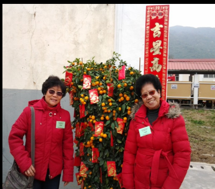
新春大吉，富貴吉祥

中心義工組於新春（18/2/2012）一起到新界行個大運，到新界區不同的景點觀光。當日我們先到林村許願樹遊覽。不少長者義工到許願樹許願，以及觀賞當地的景物。其後我們到元朗區享用豐富的九大簋。午膳過後，我們到元朗「生活源」商店購買不同種類的日常用品，不少長者義工皆買得心頭好。購物過後，我們到屯門妙法寺參觀。不少義工也在宏偉的廟宇參拜及觀賞屯門市的風景。總括來說，我們在新春行了一個大運，祝願義工組各組員身體健康，生活愉快。