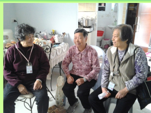
受惠長者與義工共渡快樂時光