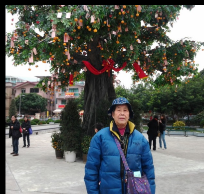
在許願樹下拍照留念