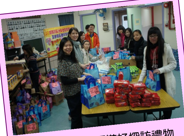
年青義工們先預備好探訪禮物

由老有所為贊助的「護老愛老·我做到」活動計劃，最後一擊就是在新春期間，將愛和祝福送給住院的長者們。現在透過相片與大家重溫當日的快樂時光！