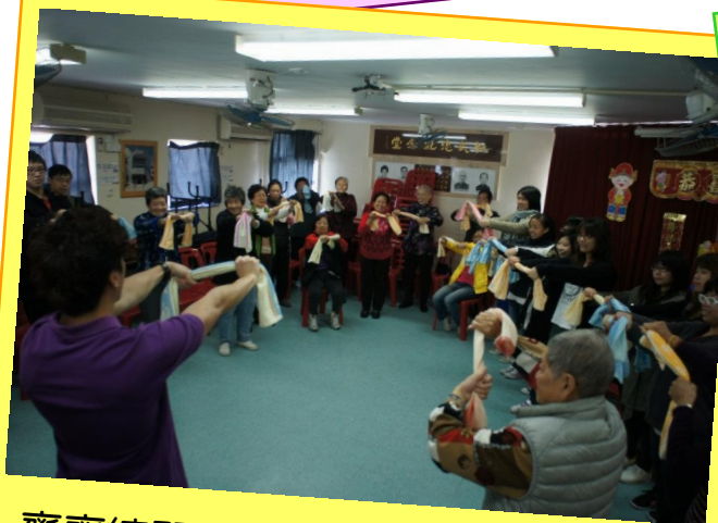
齊齊練習探訪時教長者做的毛巾操