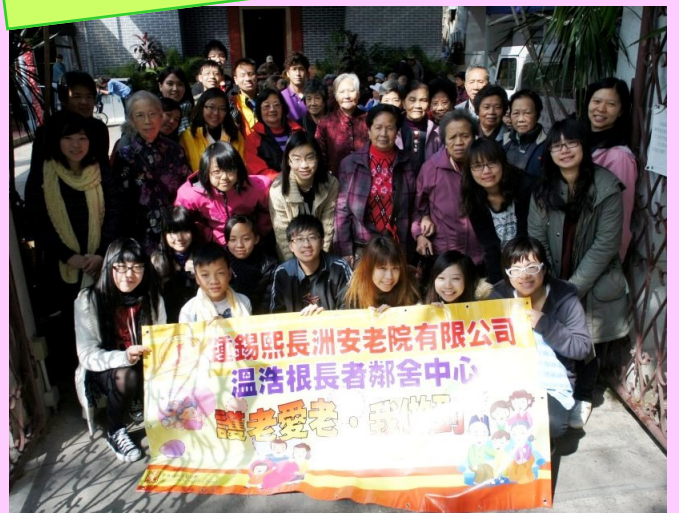
義工大合照! 謝謝各位!