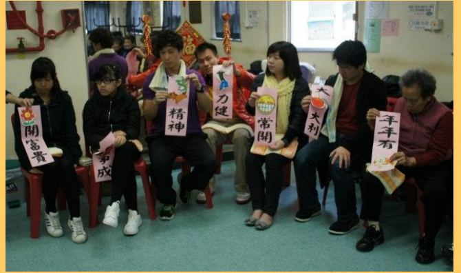
綵排探訪時與長者玩的遊戲