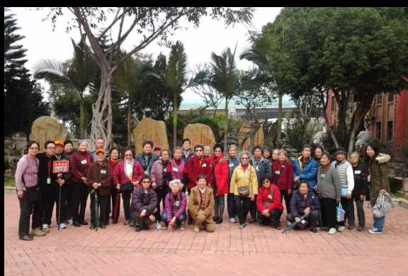
義工於妙法寺拍照留念