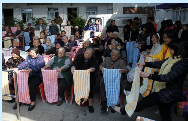
長幼義工、院友們齊齊做毛巾操，練練腳力，齊齊踢呀!!