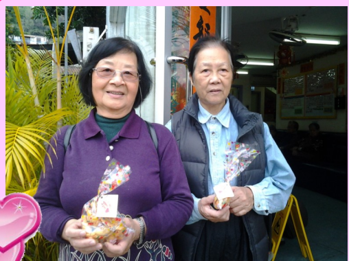
義工準備出發探訪

職員義工於探訪前精心製作精緻的賀年食品（角仔、笑口棗），並於一月十四日將賀年食品運送至本中心分派。當天共有十三名中心義工到受惠長者家探訪。受惠長者對於義工探訪感到愉快及溫暖。在這次活動洋溢和諧及歡樂的氣氛。