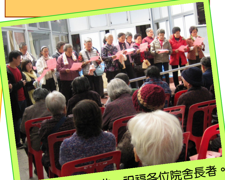
義工們高歌一曲，祝福各位院舍長者。