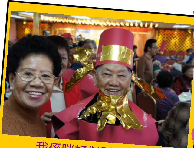
我係咪好似財神呢！